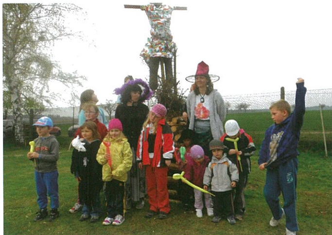
Letašní slet čarodějnic

A to je vše. Na obec velikosti Květné je to snad akcí dost. Vzhledem k stále se zhoršující dopravní obslužnosti ve večerních hodinách, kdy po zrušení zastávek vlaků v Květné se neustále ruší i další autobusové spoje a večerní kulturní akce ve Svitavách i Poličce se stávají pro dost lidí hůře dostupnými, díky bohu za to, že si lidé v obci umí alespoň nějaký společenský život zajistit sami.