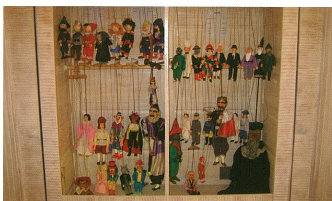
Loutkářské muzeum Chrudim