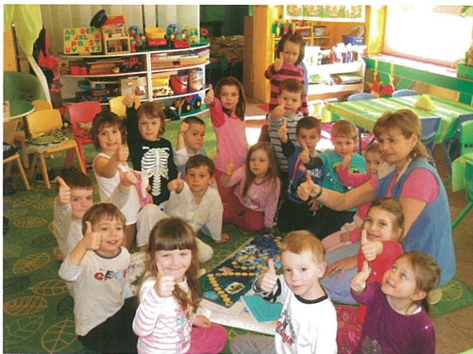
Dětem ze Slovenska se líbil náš balíček