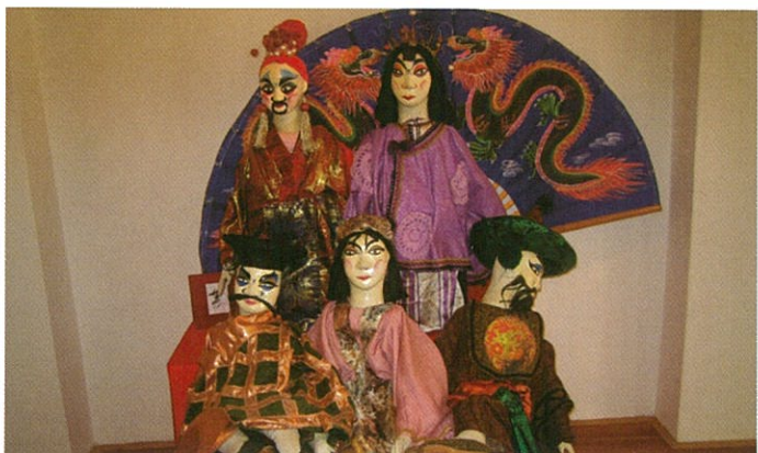
Loutkářské muzeum Chrudim