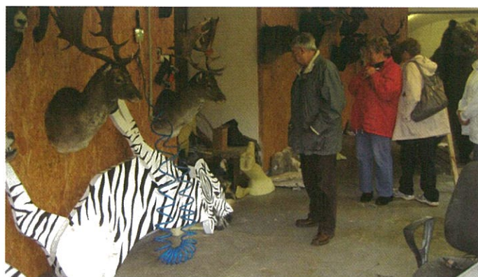
Preparátorská dílna Čistá