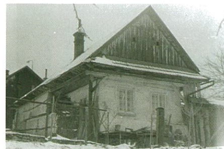
Pohled od jihu v r. 1979