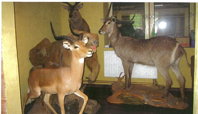
Preparátorská dílna Čistá