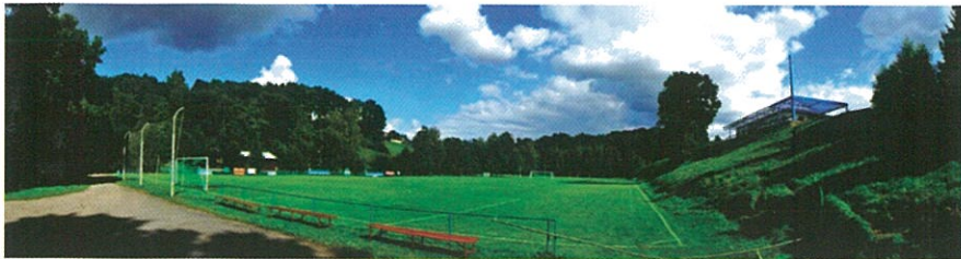
T.J. Sokol Dolní Újezd - oddíl kopané POŘÁDÁ