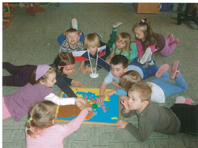
Kde najdeme ČR a SR?