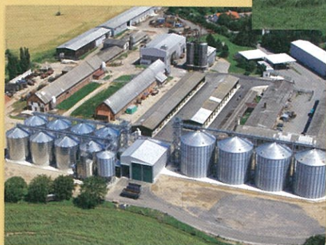
3) Posklizňová linka v Dolním Újezdě

Dne 12.3.2010 vlastníci a zaměstnanci Zemědělského družstva Dolní Újezd výročními členskými schůzemi uzavřeli rok 2009. Byl to rok mimořádně nepříznivý. Došlo k obrovskému propadu cen zejména u rozhodujících výrobků družstva tj. u obilovin a mléka. Prodejní ceny zemědělských výrobků poklesly hluboko pod úroveň vlastních nákladů např. u mléka se ceny snížily v některých měsících až na 5,80 Kč/lit, přitom vlastní náklady se pohybují od 7,50 - 8,00 Kč/lit. Dopad cenové krize byl o to závažnější, že družstvo je největším producentem mléka v České republice. Denní prodej činí 50 000 litrů, dokázal by zásobit 70 tisícové město.