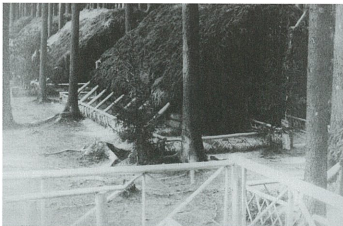
Zemlijanky ve sběrném táboře