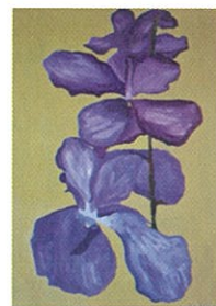
Malba: Martina Štanclová

Které se konají v pondělí 26.4.2010 a ve středu 28.4. 2010 v 16:00 hod. v sále Základní umělecké školy