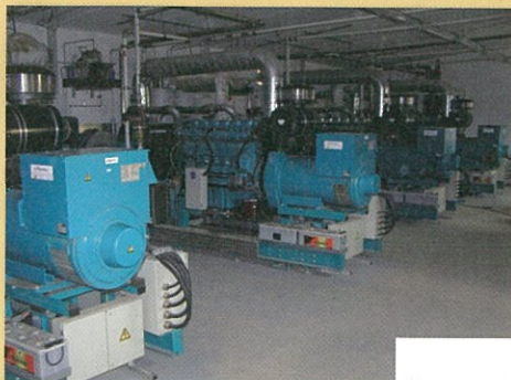
1) Generátory na výrobu elektrické energie