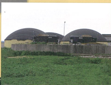
2) Bioplynová stanice ve Vidlaté Seči