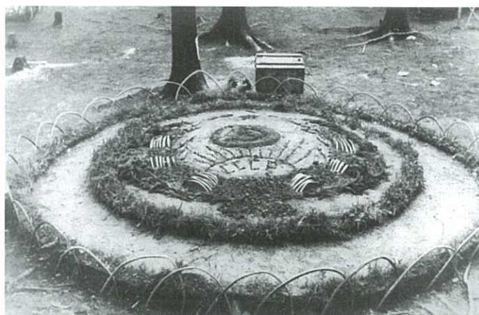
Výzdoba v táboře