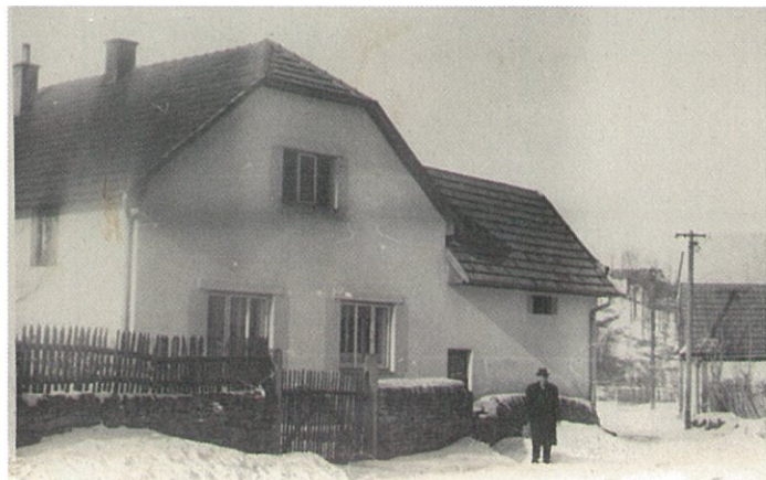
Chalupa č. 44 v 60. letech