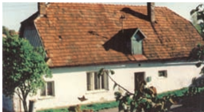
Chalupa č. 58 pohled od západu v 80. letech.