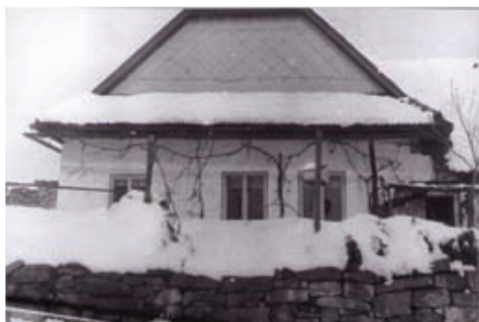
Chalupa č. 58 v 50. letech - pohled z jihu.