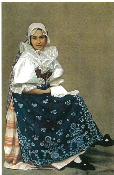
Kroj poličského panství