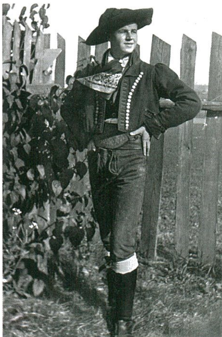
Mužský letní kroj poličského panství