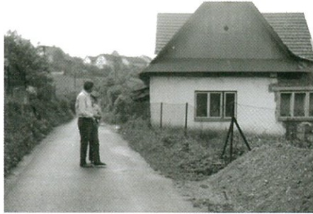
Stavební úprava v r. 1973