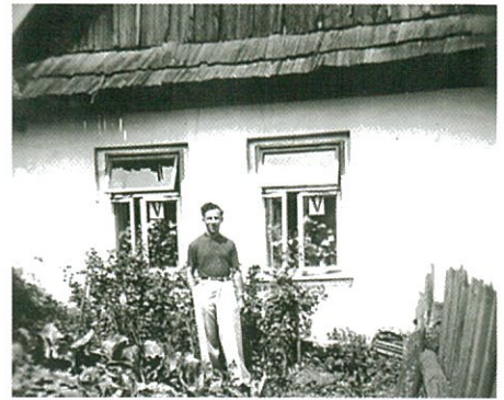
Chalupa č. 89 r. 1960