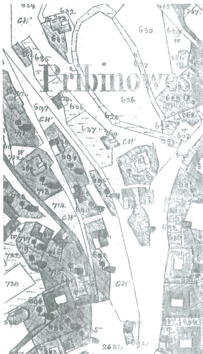
Stabilní katastr 1839