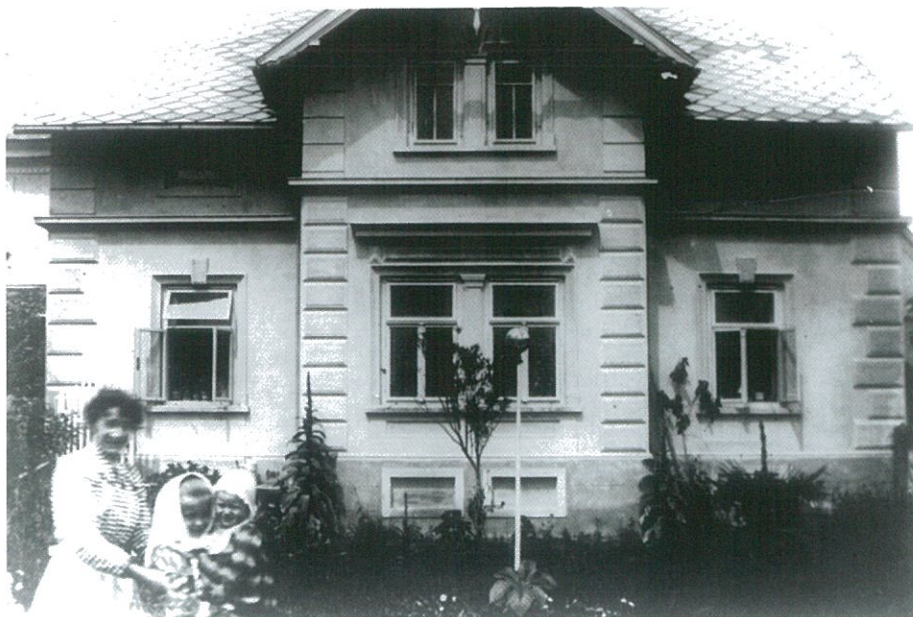
J.J. a Z.H. Vila č. 133 na Rovince