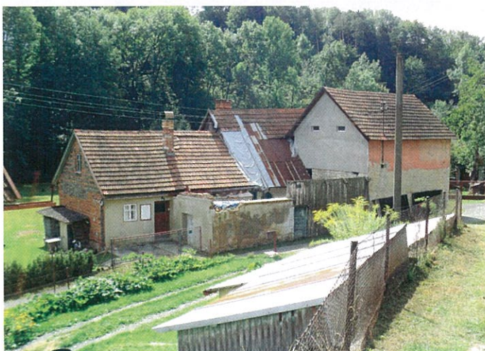
Chalupa č. 100 pohled od severozápadu, současný stav