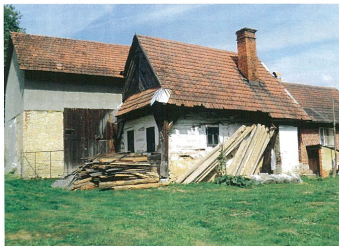
Chalupa č. 100 pohled od jihovýchodu, současný stav