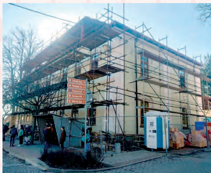
současný stav (rekonstrukce)