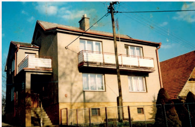
čp. 236, stavěno 1970-74