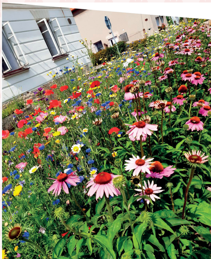
Květinová louka před muzeem