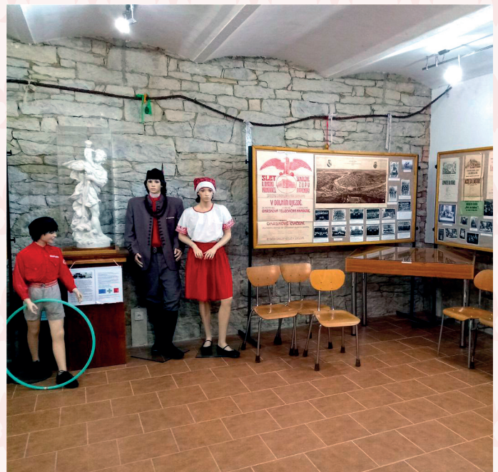
Výstava „110 let Tělocvičné jednoty Sokol Dolní Újezd“