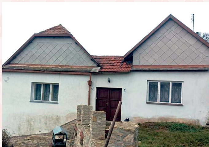
Chalupa č.p. 244