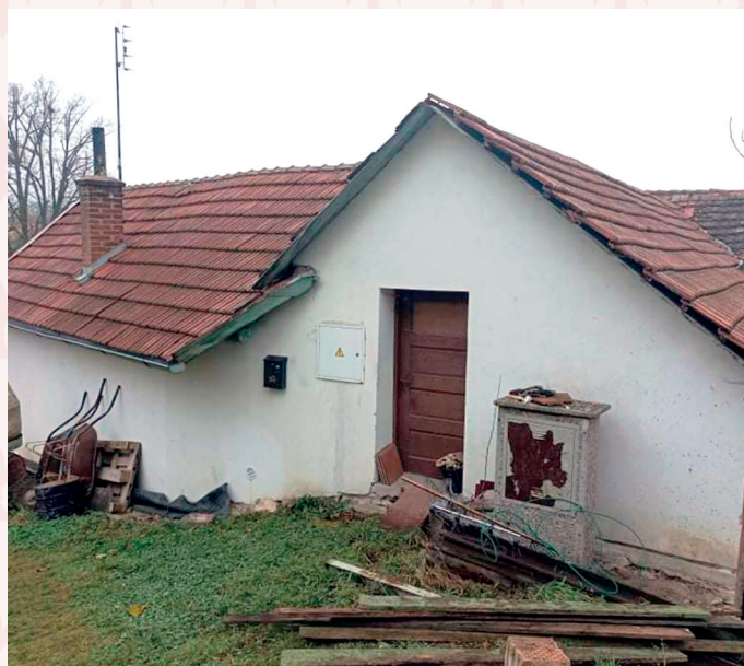
Chalupa č.p. 244