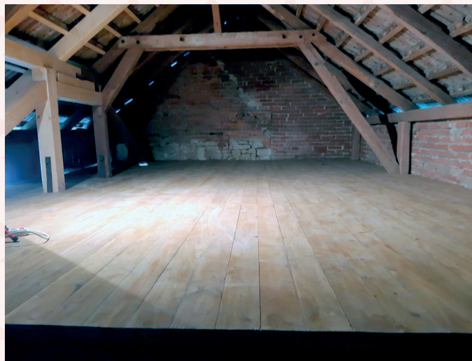
Nová podlaha horní podstáje a oprava vazby krovů střechy