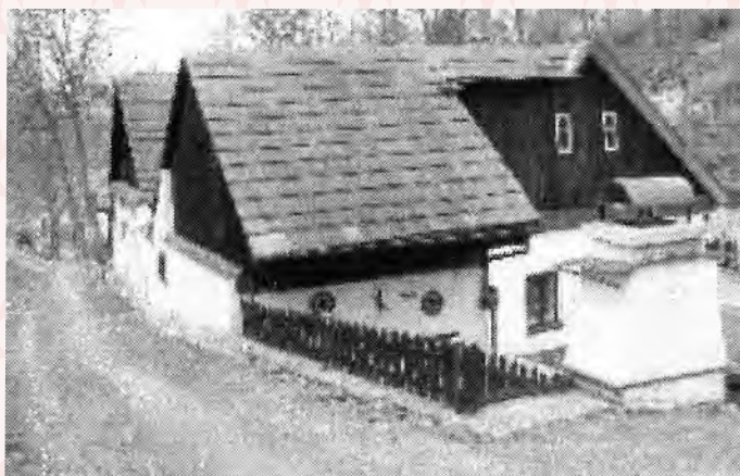
původní stav čp. 288