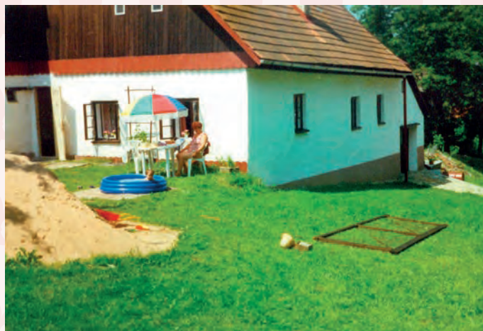
současný stav čp. 288