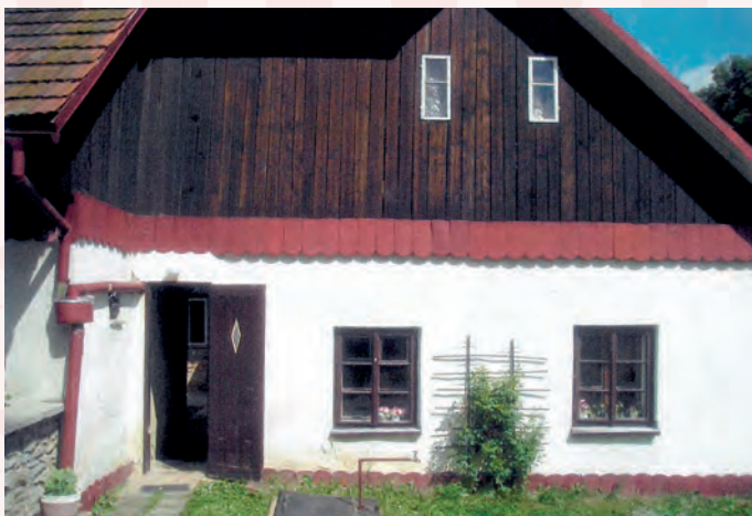
současný stav čp. 288