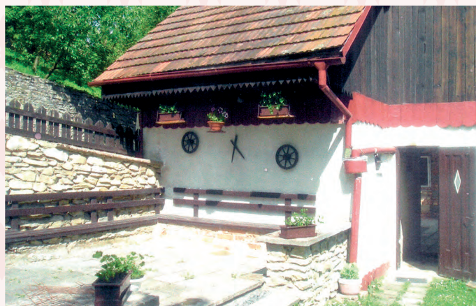
současný stav čp. 288