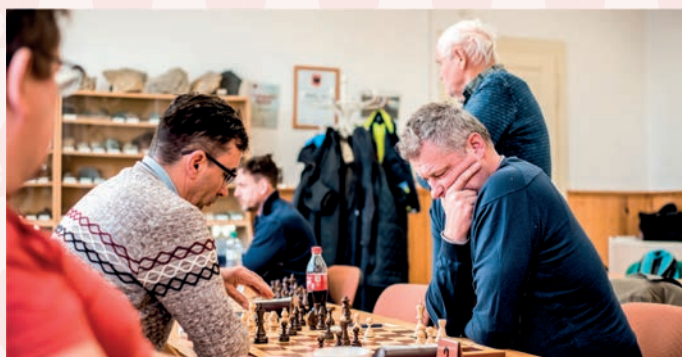
v šachu platí: Když se figury dotknete, musíte s ní hrát. Šachista nalevo už má téměř jasno