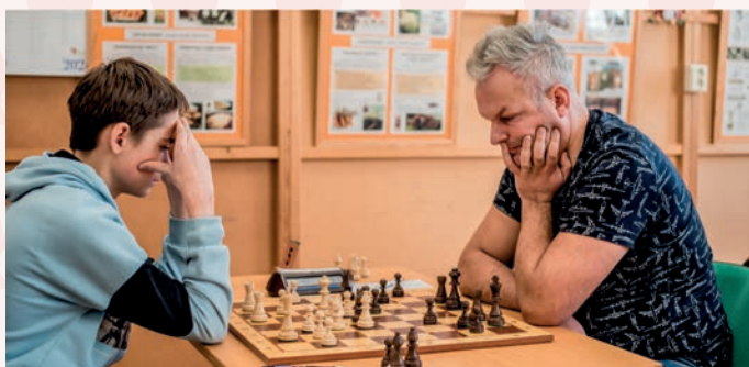
jen znalosti královské hry nestačí. Ve vážné partii vyhrává i ten, kdo má větší výdrž, houževnatost a pevnější nervy, protože hra může trvat také kolem pěti hodin