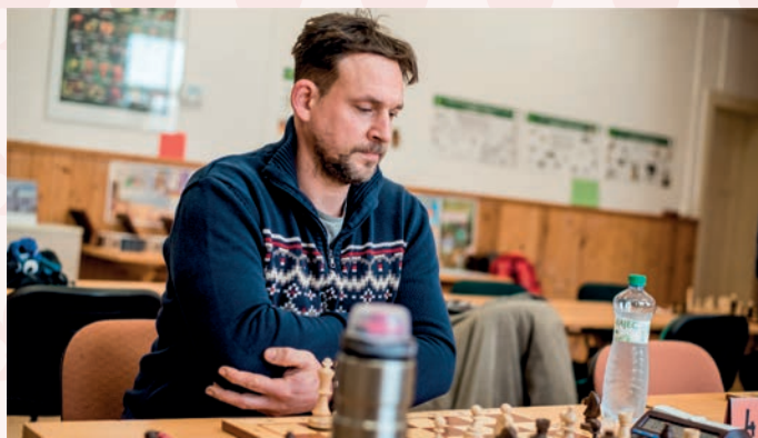
mít převahu na hracím prkně také znamená neunáhlit se