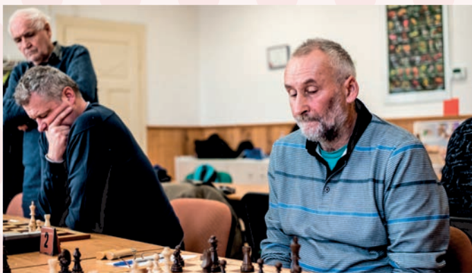
vyhranou partii je třeba vyhrát, což ví každý šachista