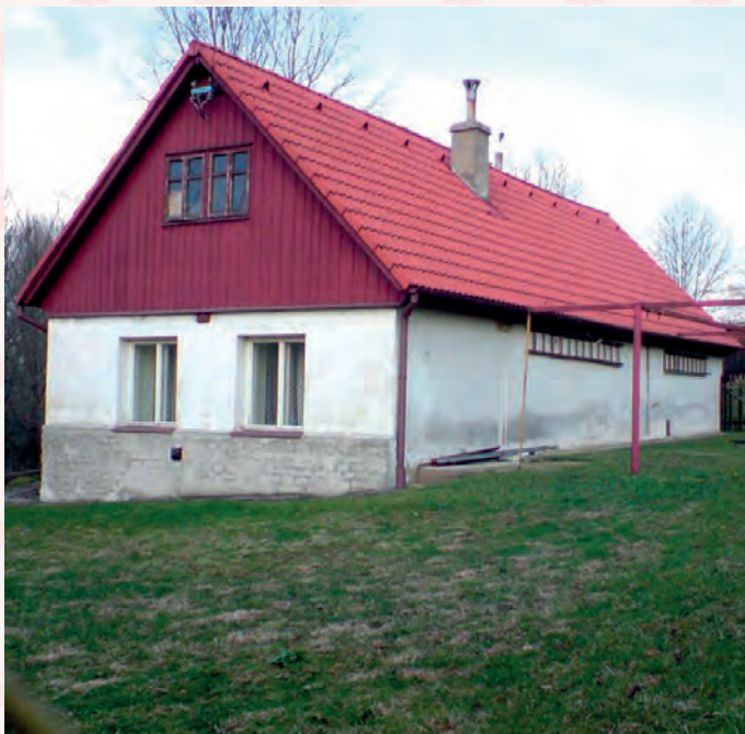
původní stav 2011

Firma Tesaři Osík s.r.o. nabízí k prodeji palivové dřevo – odřezky.