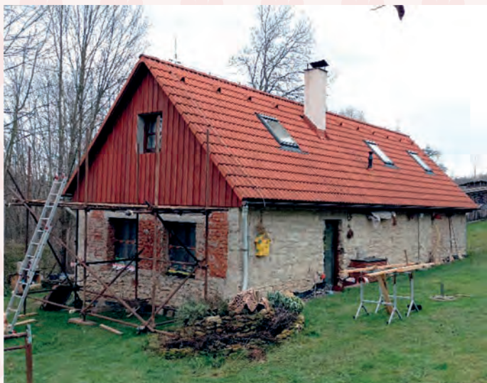
nynější stav 2022 (nadále v rekonstrukci)