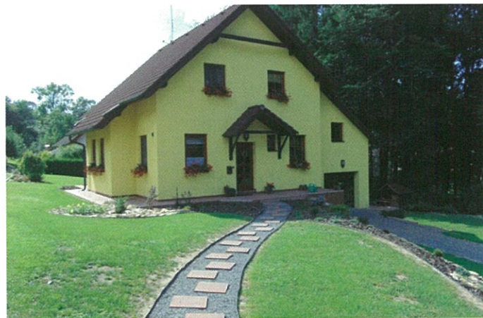
Rodinný dům čp. 608