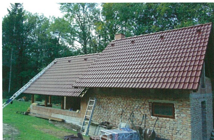
Zahradní dům na místě chalupy čp. 192