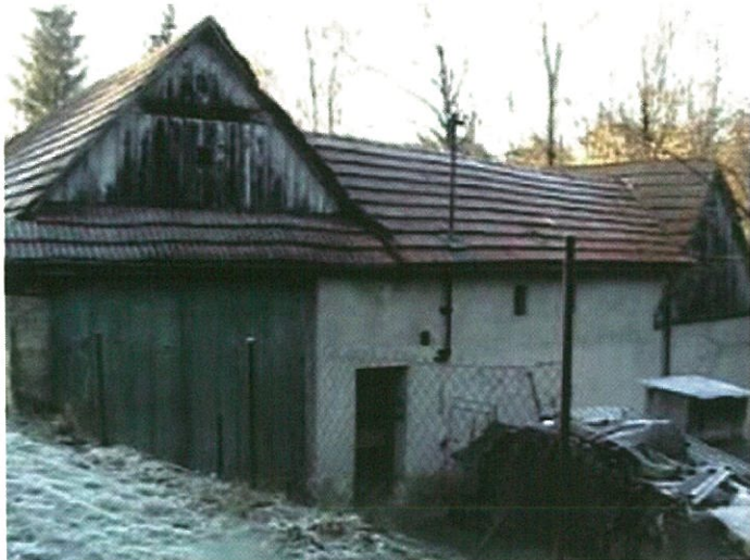
Chalupa čp. 192