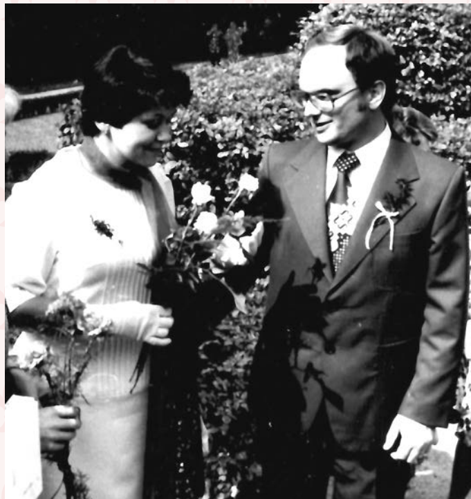
J.J. a Z.H.