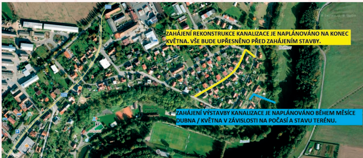
kanalizace sídliště Bořkov