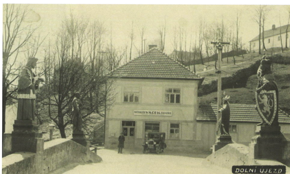
Čp. 195 v r. 1932