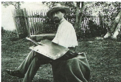
v působišti Maxe Švabinského

4.května - 16.června 2019 každou neděli 14.00 - 17.00 hod. Regionální muzeum Dolní Újezd