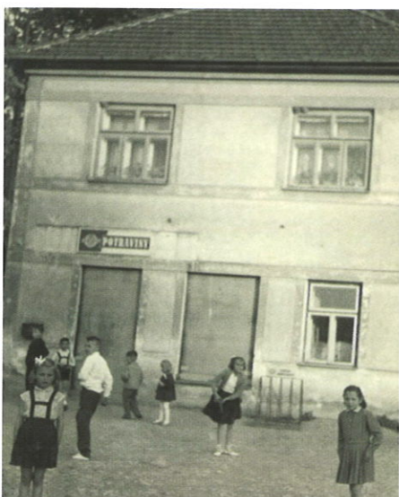
Čp. 195 v r. 1960