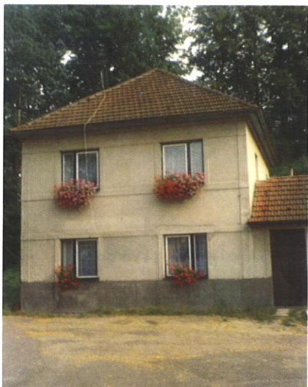
Čp. 195 v r. 2001