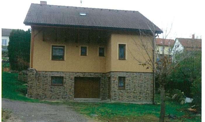
Nový RD, stav 2018