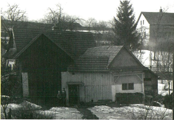
Chalupa č. 202 v 60. letech