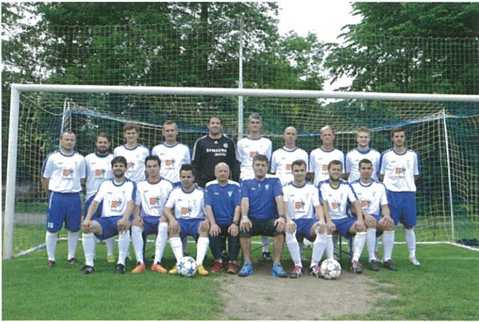
Muži „A“ - postup do Krajského přeboru