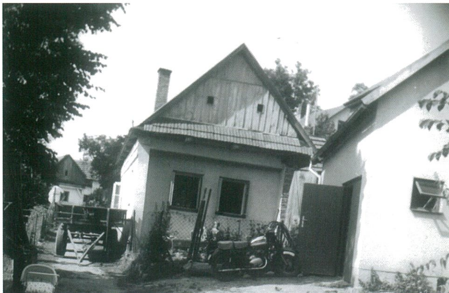
Chalupa čp. 148 kolem r. 1965