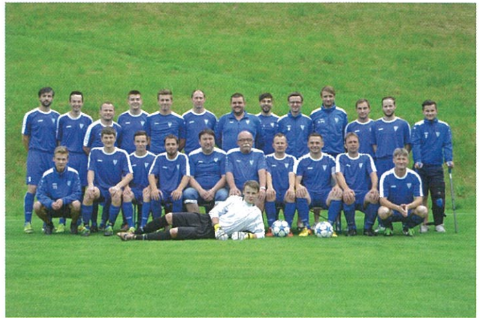
Muži „B“ - postup do Okresního přeboru