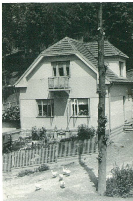
RD. č. 68 kolem r. 1950