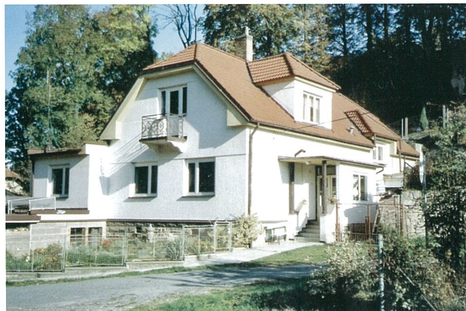
RD č. 68 v r. 2005