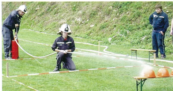
Čistá - sestřelení cíle pomocí džberovky