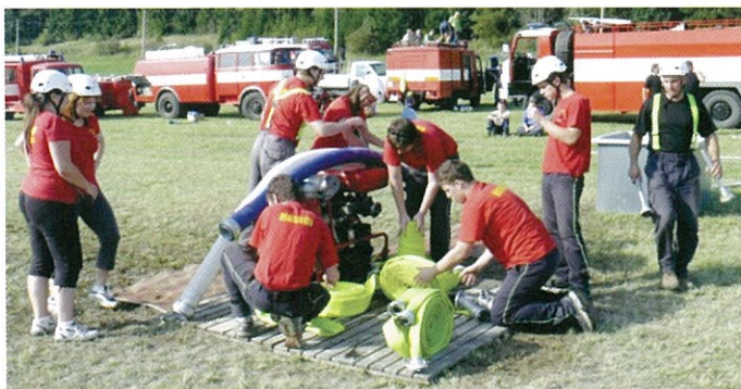
Říčky v Orlických horách - příprava na požární útok