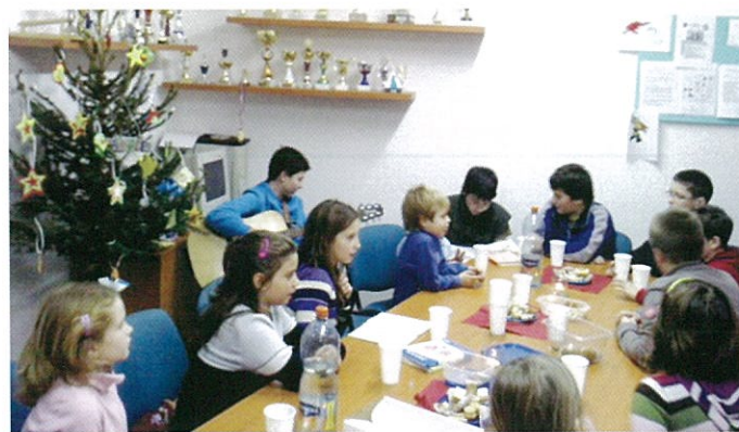
Vánoční besídka v klubovně