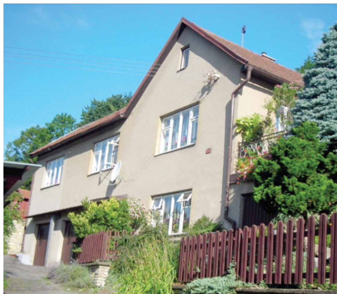
Současný stav RD č. 63